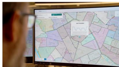
Interfície de l'entorn de predicció del trànsit a València / ITENE

Amb una precisió de més del 90%, este pronòstic permetrà l'optimització de rutes de repartiment