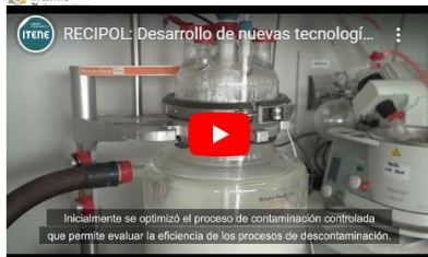
ITENE RECIPOL: Desenvolupament de noves tecnologies... Inicialment se optimitzà el procés de contaminació controlada que permet avaluar la eficiència dels processos de descontaminació.